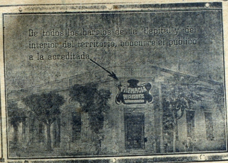
De todos los barrios de la Capital y del interior del territorio, concurre el público a la acreditada