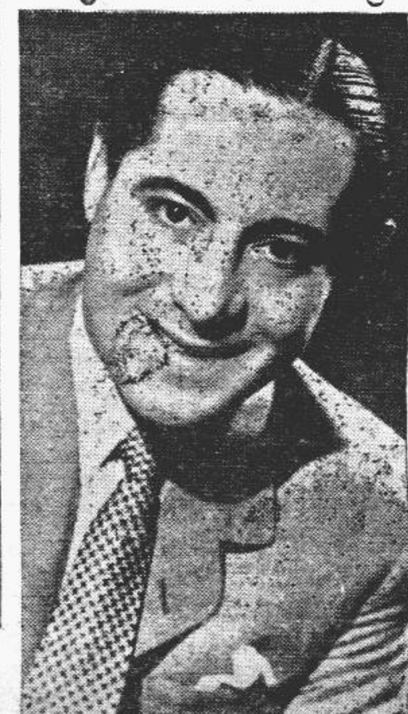
JUAN ROSSI "El Frégoli de la Voz" que el sábado actuará en la fiesta de la Cruz Roja en el Edificio de la Exposición

El sábado y domingo próximos en el Salón Exposición del Parque R. del Paraguay se realizarán dos grandes bailes organizados por la filial Misiones de la C. Roja Argentina, a total beneficio de la misma con el objeto de recaudar fondos para la adquisición de ambulancias y otros materiales con que cumplir su humanitaria labor.