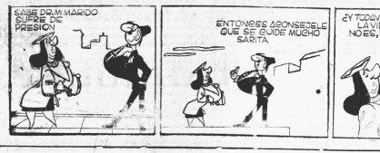
Una ilustración de la carta de Santo Pipo...