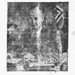
Sr. Paul Hoffman, administrador del Plan Marshall de rehabilitación europea.

WASHINGTON, 10. — Ha causado gran sensación las declaraciones hechas por el administrador General del Plan de rehabilitación europea, Sr. Paul Hoffman, en el sentido de que tiene un estudio de desmantelamiento de la industria alemana afectada dentro del programa de reconstrucción de guerra. El Cancellor Britán, en un momento de su discurso sobre el programa de reconstrucción de guerra, se refirió a las industrias alemanas afectadas por la guerra, instando a otros puntos de Europa donde podrían dar mayor rendimiento.