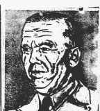
Secretario de Estado norteamericano General Marshall