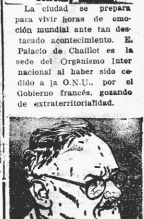
Secretario de Estado norteamericano General Marshall