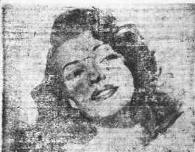
...RITA HAYWORTH y los diez preciosos trajes de baño que ha traído de París. En la figura que caben todos en una caja de pañal. Dos señoras de 1949 y los señores políticos apenas ven. En las fotografías en blanco y negro, apenas las vienes las señoras de la Columbia, con el enfático NO.