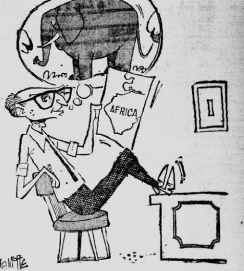
FRONDIZI.— Haré otro viaje... ¡y extenso! Si me critican voy sordo. ¡Porque del AFRICA, pienso, puede salir "algo gordo".