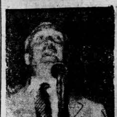
Sin confirmación se anunció ayer en la Unión Cívica Radical del Pueblo...