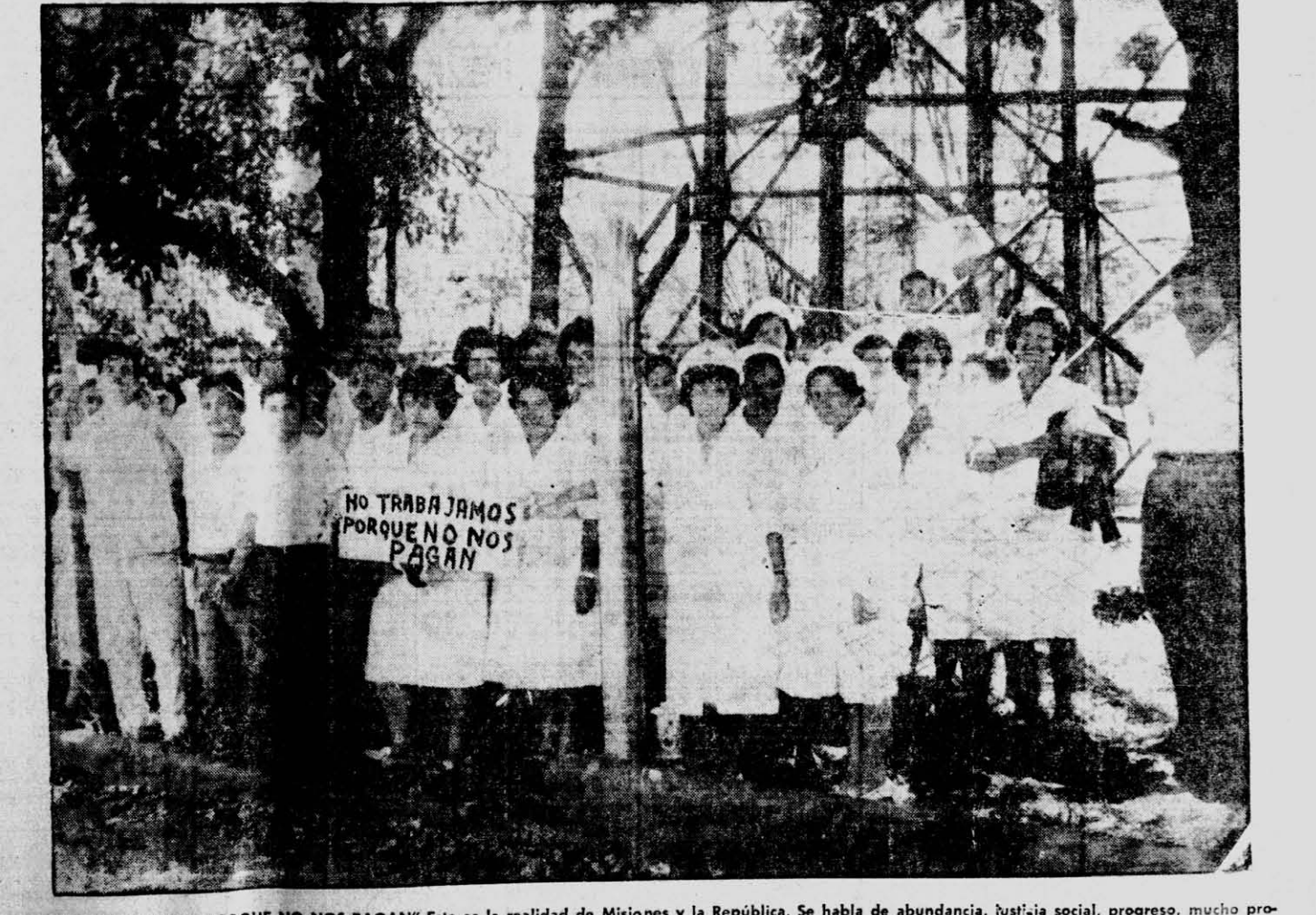
"NO TRABAJAMOS PORQUE NO NOS PAGAN" Esta es la realidad de Misiones y la República. Se habla de abundancia, justicia social, progreso, mucho progreso. Esto no es crítica destructiva como dice la UCRP. Es la triste realidad de empleados del gobierno que deben hacer huelga porque no hay plata para pagarlos.