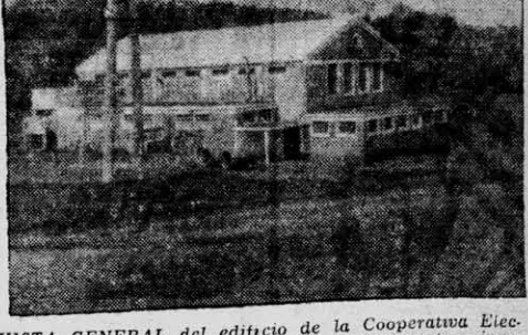
VISTA GENERAL del edificio de la Cooperativa Eléctrica Ltda. Oberá que hoy quedará totalmente inaugurado.

OBERA. (C) — Está anunciada para hoy a las 19, la inauguración oficial y puesta en marcha de los grupos electrogenos de la Cooperativa Eléctrica Limitada Oberá (C.E.L.O.).