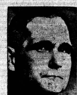
Hess, brazo derecho de Hitler.