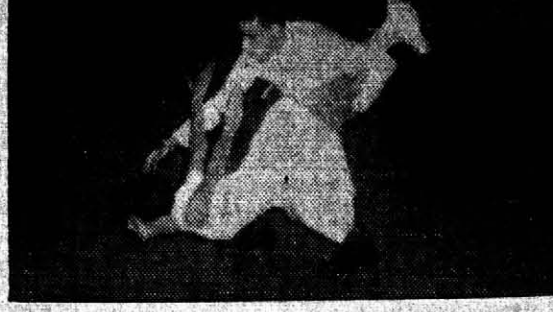
FESTIVAL DE PATIN en el Club Ucraniano de Apóstoles: El profesor Valle con la pequeña Sussi, en un pasaje del vals.