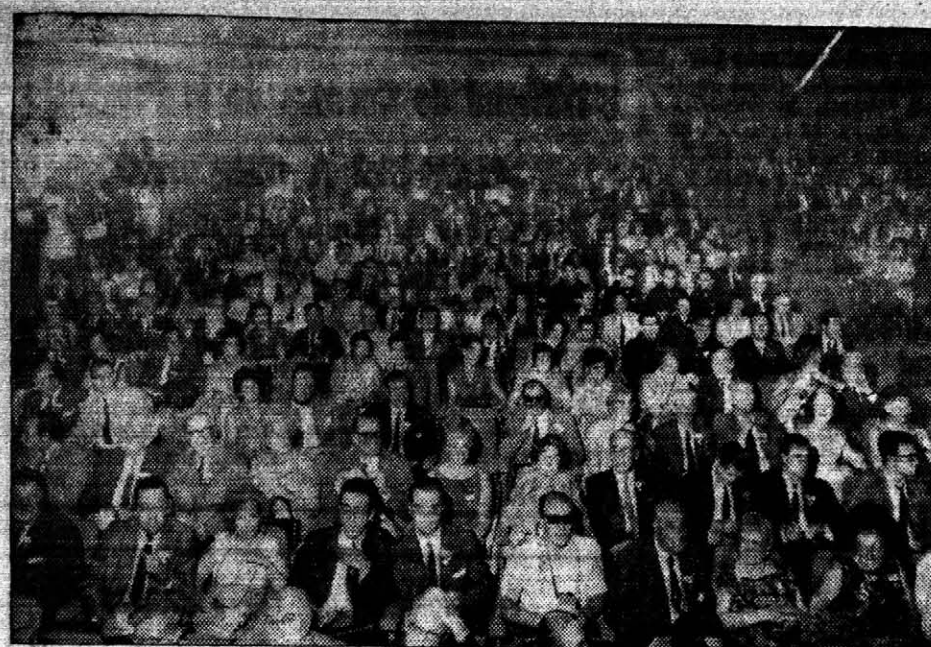
UNA DE LAS SALAS — El grabado ilustra la importancia que concedieron los siquiátricos del mundo al Congreso que se realiza en Madrid: se trata de una de las muchas salas en que se desarrollaron las deliberaciones del Congreso.