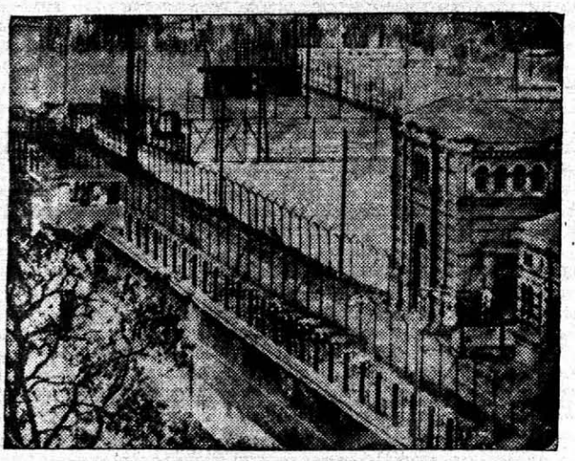
Spandau queda en el límite de los lados oriental y occidental de Berlín. Un lado de la penitenciaría es guardado por soldados norteamericanos y el otro por soldados rusos.