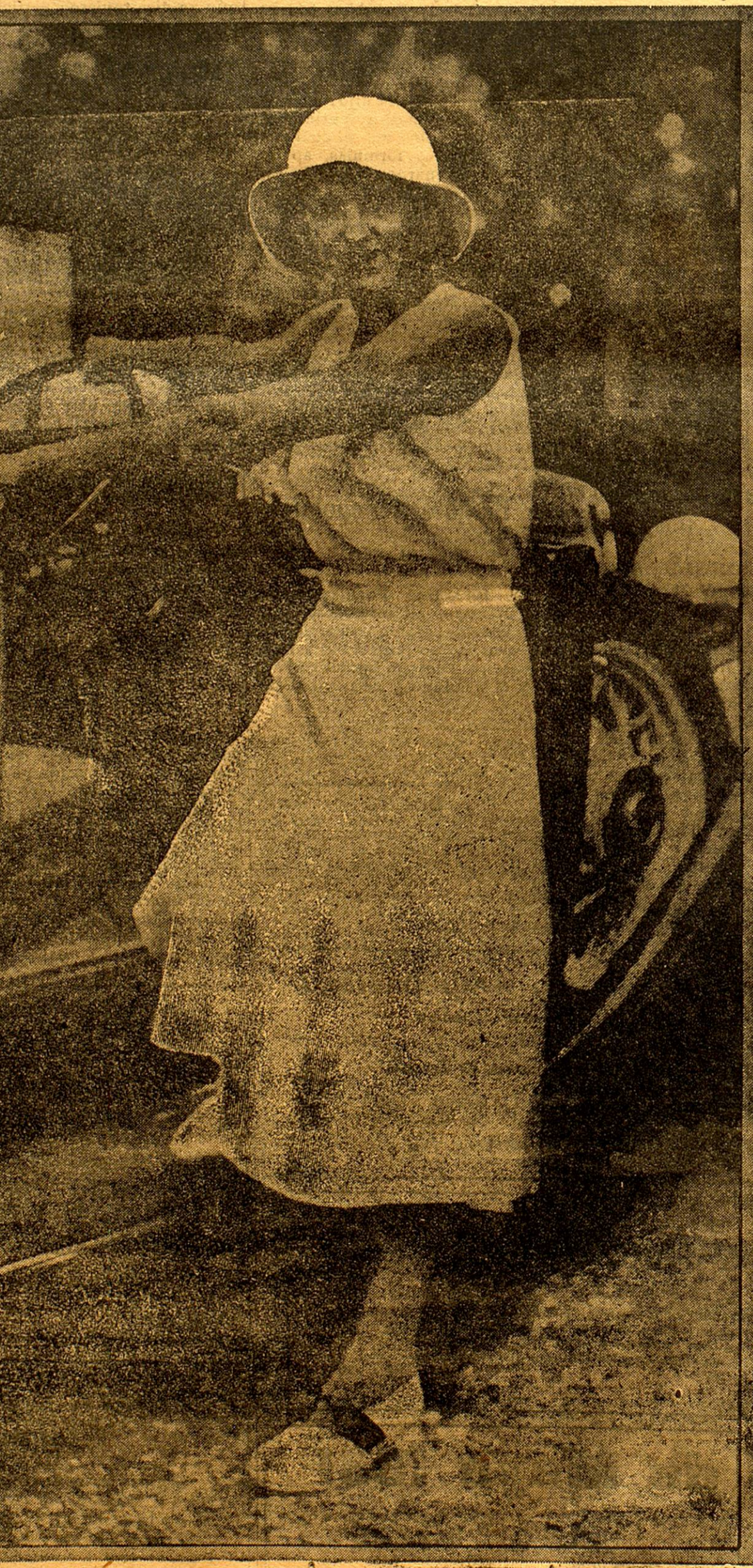
Por todas partes donde lo lleven sus paseos encontrará usted que miran con interés su coche, con aprobación de la belleza de sus líneas. La capota baja, bien replegada tras el asiento realza las líneas de este hermoso modelo que el equipo completo de uso hace agradable. Así para el viajero en el campo.