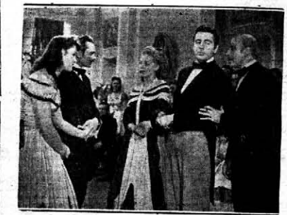
Una escena de LA CASA DE LOS CUERVOS que el Sarmiento estrena esta noche en sección nocturna