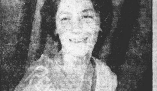
REINA: Durante los bailes de Carnaval realizados en esta localidad fue elegida la reina, designación que recayó en la representante del Club Atlético...