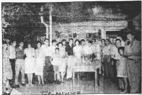
REUNION: La colonia paraguaya de Libertador General San Martín se reunió en esta escuela para celebrar el nuevo aniversario de la Revolución Paraguaya de 1932...