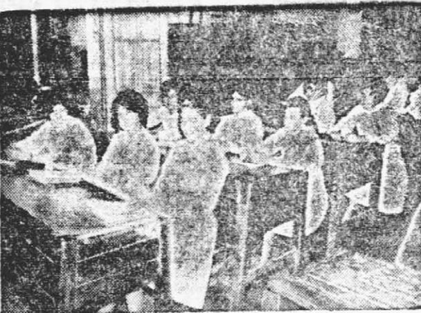
SERAN MAESTRAS DE OBRAS. Estas jóvenes dan un ejemplo de aspiración femenina hacia labores antes únicamente ejercidas por el hombre. Y su aplicación e interés por la carrera, garantiza de antemano que la culminarán con éxito.

En el primer año con 16 horas de cátedra. Cuenta con 20 alumnos inscritos, egresando con el título de instaladores eléctricos.