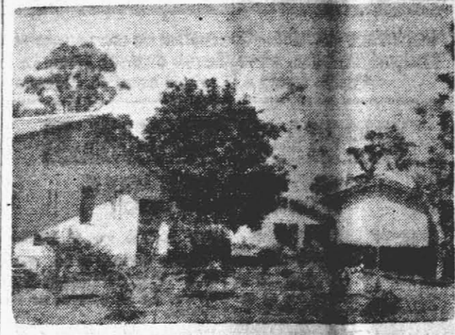
VISTA PARCIAL. — Esta es una vista parcial del Sanatorio Balaña, uno de los centros de internación de enfermos del mal de Hansen de mayor capacidad en el país.