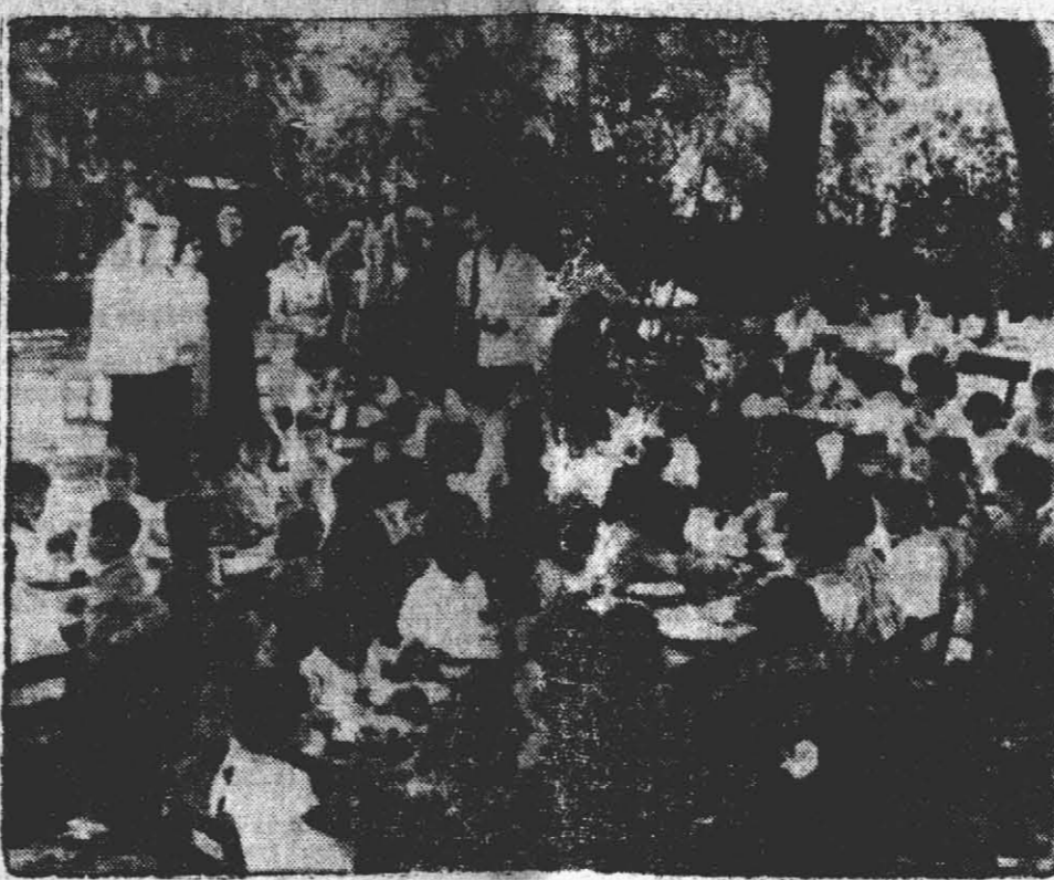
EN LA GUARDERIA.— Alrededor de 100 pequeños internados, fueron agasajados en la Guardería N. Señora de la Misericordia, por personal de la Policía Federal. En la presente nota aparecen autoridades de la casa y jefes de dicha repartición policial, junto a los agasajados.