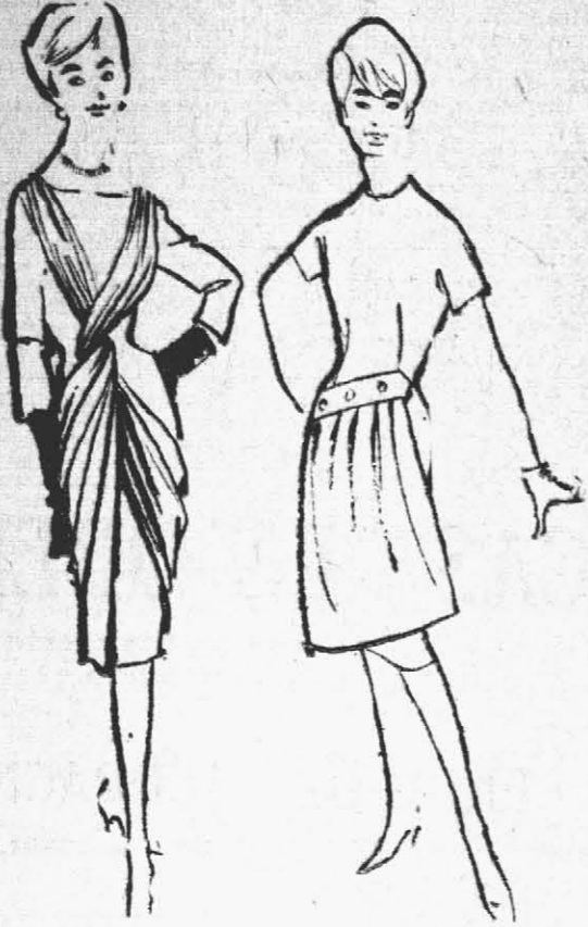
TORZADA drapada dá realce a este vestido de tarde ajustado. El otro modelo, de lantal con pliegues y botones.