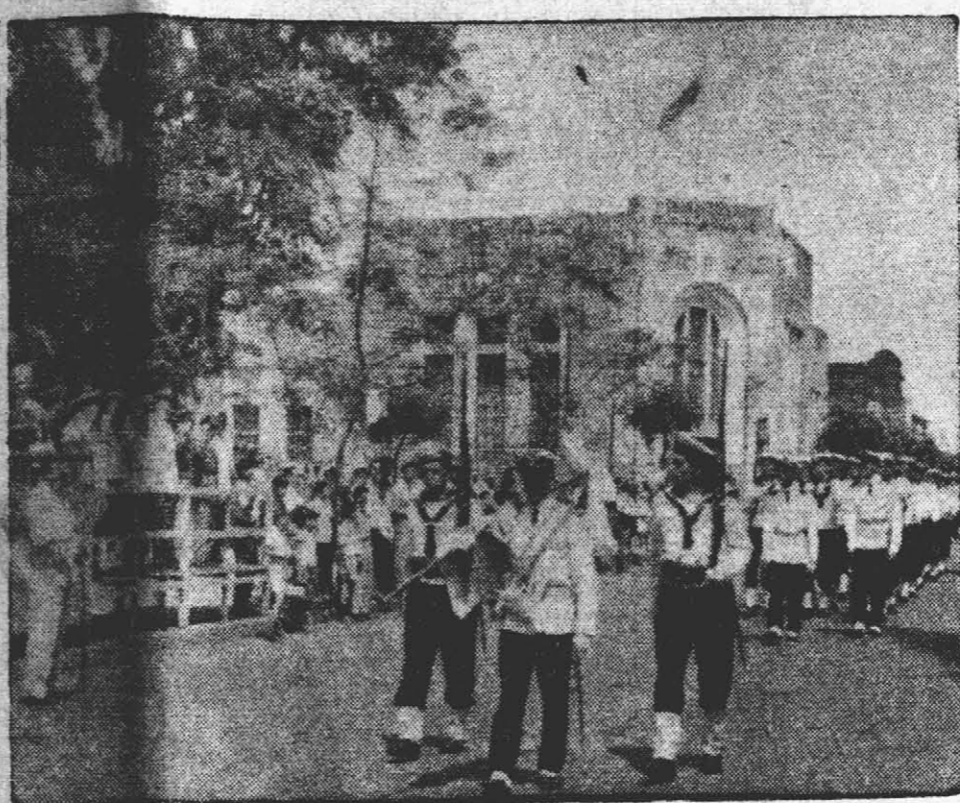
CONMEMORACION.— Con motivo de conmemorarse ayer el Día de la Prefectura Nacional Marítima, se realizaron diversos actos. La nota enfocó un instante del desfile frente a la iglesia catedral. (información en la página 4)

La Comisión Provisoria, denuncia ante la opinión pública, al Poder Ejecutivo como el único responsable de los acontecimientos ya producidos y los que pudieran suceder y, exhorta a los trabajadores, a disponerse a secundar con todas sus fuerzas a los compañeros ferroviarios".