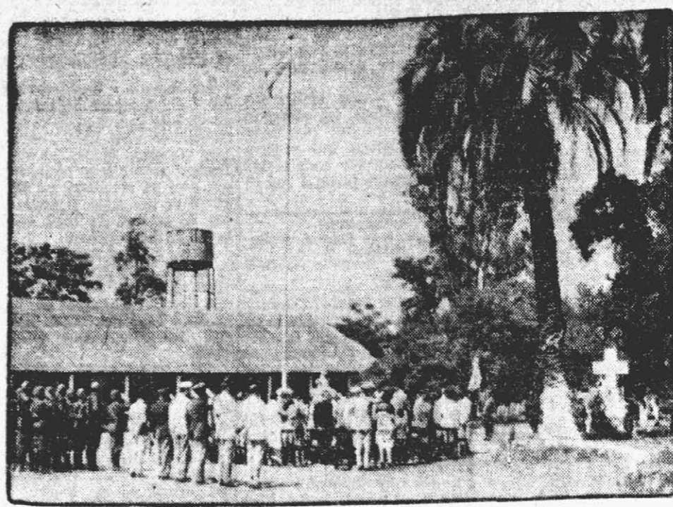
EL DESTACAMENTO 4 DE MONTE celebra su primer aniversario. En la foto gráfica puede apreciar el lector un momento de la Misa de de Campaña oficiada en el parque de la Unidad.