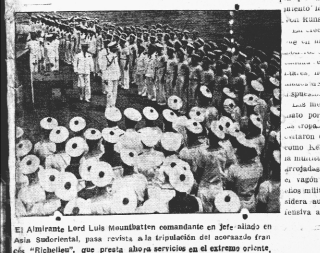
El Almirante Lord Louis Mountbatten comandante en jefe aliado en Asia Suroccidental, pasa revista a las tropas del 36º ejército francés "Richelieu", que presta ahora servicios en el extremo oriente.