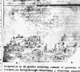
Soldados de la 58 división británica cruzando el ancha río Irrawady, en Katha, durante interesantes y victoriosas operaciones en Birmania.