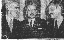
Georges Bidault, (centro) ministro de Relaciones Exteriores de Francia, se despidió del Subsecretario de Estado Grey, después de una conferencia con el presidente Truman a su paso por Washington en un viaje de regreso de San Francisco a París. Se trató en un momento de la cooperación de la Unión Soviética en el conflicto que acaba de ser resuelto satisfactoriamente. Bidault, por su parte, ofreció la cooperación de Francia en la lucha contra el Japón.