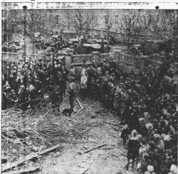
Los habitantes de Eriksen, ciudad renana, acuden a la intendencia para ser anotados por los autoridades militares y alemanas, a los fines del racionamiento y de impedir las actividades de espionaje.