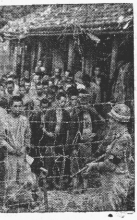
Un grupo de prisioneros japoneses en un campamento de Okinawa. La l6gica defensa de esta isla co- st6 al enemigo m6s de 100.000 hombres. Muchos de los japoneses apresados, intentaron escapar d6ra- zos de palenas.