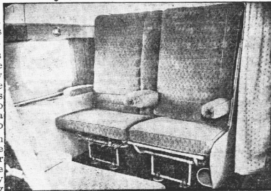
Esta foto de una idea de las comodidades que ofrecen los nuevos buses voladores británicos "Sandringham" con capacidad para 24 pasajeros y 3,500 kilos de carga y correspondencia.