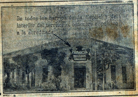
De todos los barrios de la Capital y del interior del territorio, concurre el público a la acreditada