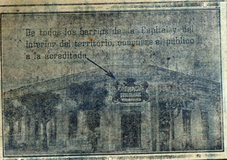
De todos los barcos de la Capital y del interior del territorio, concurre al público a la acreditada