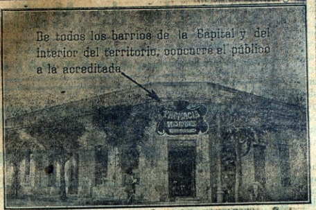
De todos los barrios de la Capital y del interior del territorio, concurre el público a la acreditada