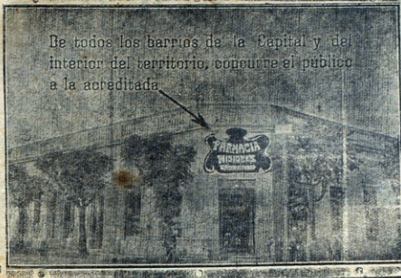
De todos los barrios de la Capital y del interior del territorio, concurre el público a la achadada