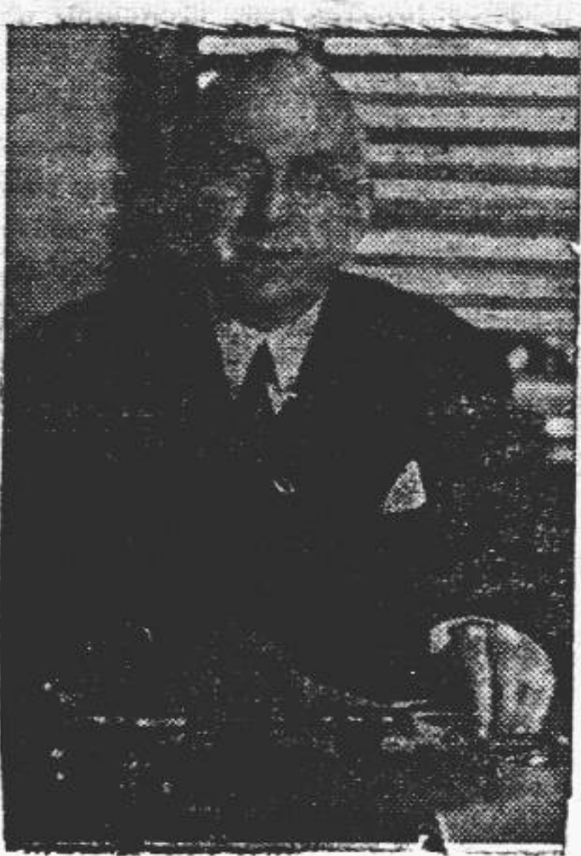
El Embajador Messersmith llegó el sábado. Perón lo recibió con un abrazo

El señor Messersmith, formuló breves declaraciones a los periodistas refiriéndose a su estadía en su país donde tuvo oportunidad de conversar con el nuevo Secretario de Estado General Marshall, sobre diversos problemas que interesan a Norte y Sud América. Finalmente expresó que se sentía muy feliz de estar nuevamente entre los argentinos.