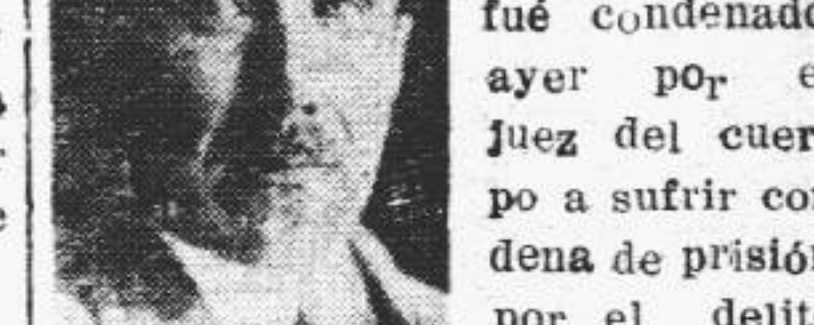
VON PAPEN de falso testimonio.

NUREMBERG, 5. — El viejo diplomático nazi Franz Von Papen que está siendo juzgado por un tribunal de desnazificación fué condenado ayer por el juez del cuerpo a sufrir condena de prisión por el delito de falso testimonio. Papen incurrió en diversas contradicciones y mentiras al investigarse el origen y la autenticidad del documento en el cual aparece Adolfo Hitler como heredando el poder de Alemania de parte del mariscal Hindenburg, documento que al parecer fué traído por el diplomático.