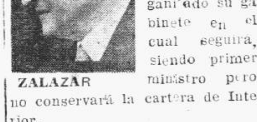
ZALAZAR no conservará la cartera de Interior.

LISBOA, 5. — El primer ministro y virtual dictador de Portugal ha sorprendido ayer con el anuncio de haber reorganizado su gabinete en el cual seguirá, siendo primer ministro pero no conservará la cartera de Interior.