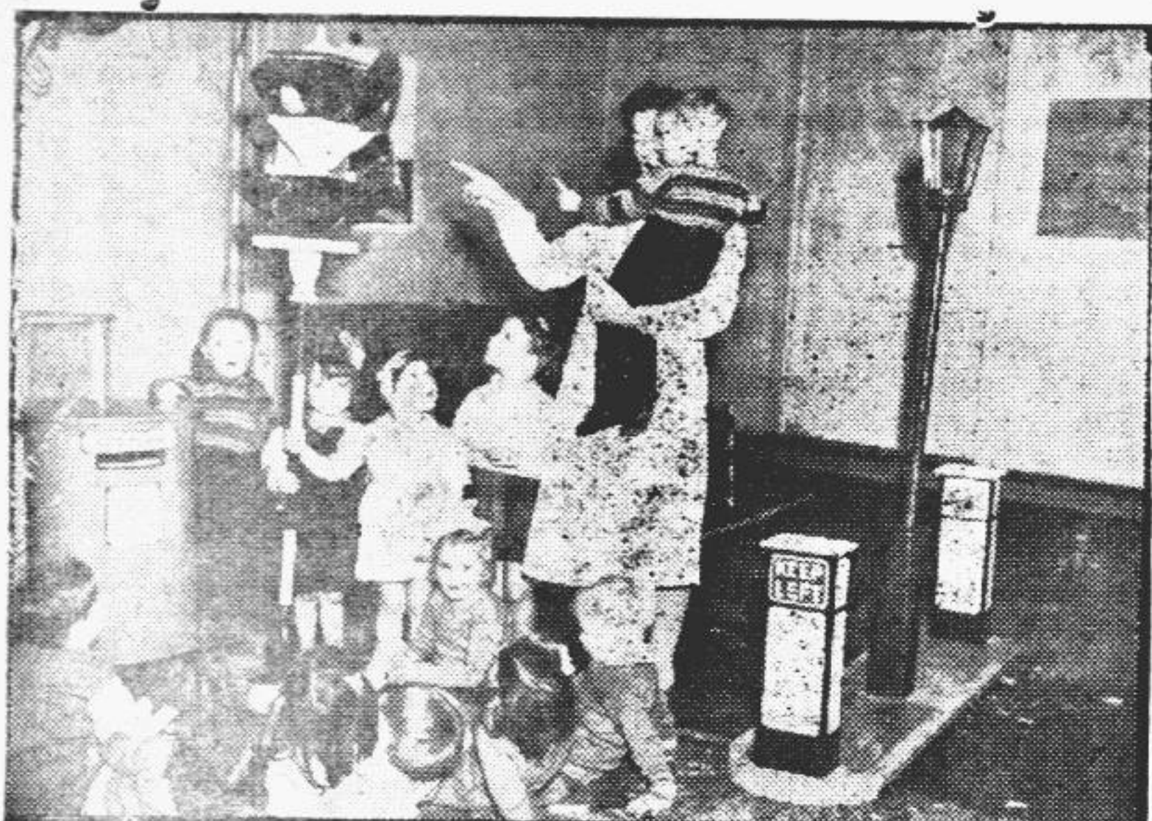
Una celadora explica a sus pequeños oyentes del Jardín de Infantes distintas cuestiones relacionadas con las ordenanzas del tránsito.