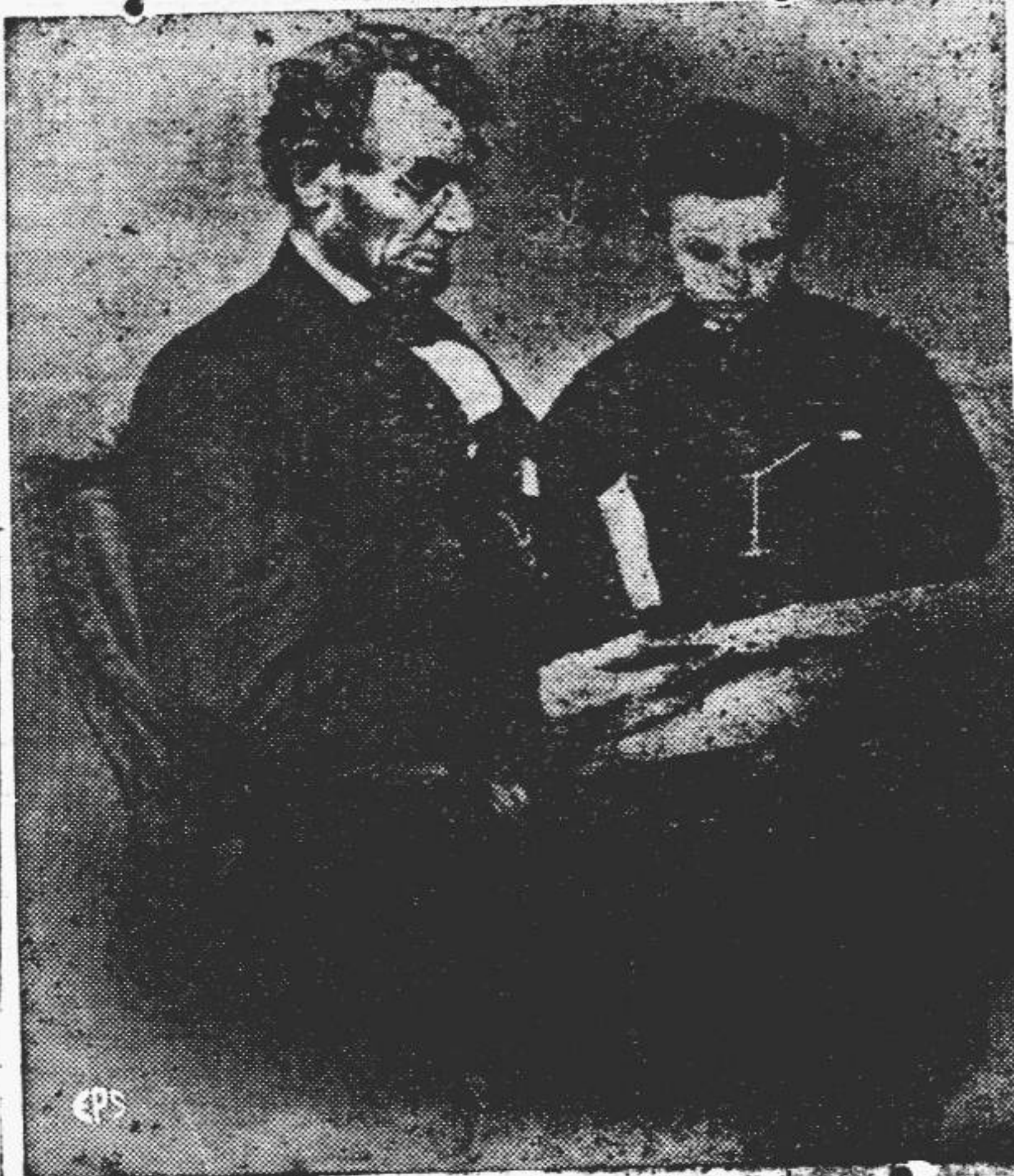
Abraham Lincoln y su hijo Tad

Se conmemora en E. U. el 138 aniversario del nacimiento de Abraham Lincoln.