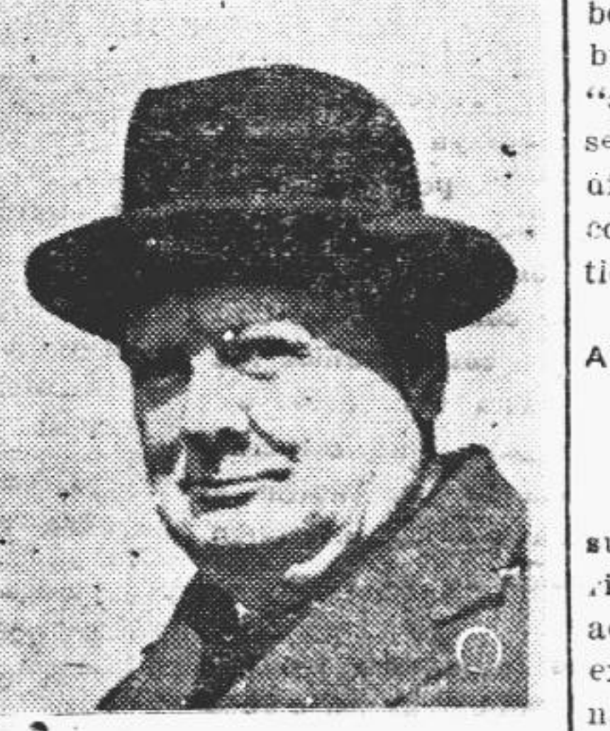
Los Laboristas hunden al Imperio

En Londres la Cámara de los Comunes fué escenario de violento en Tierra Santa.