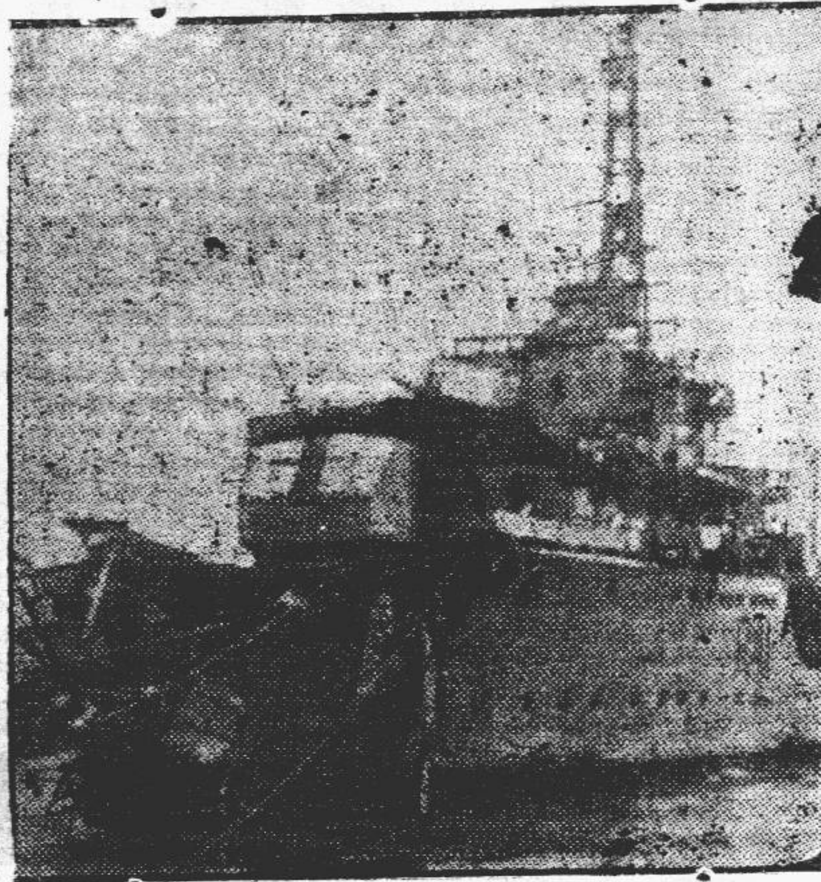
Aspecto de la proa del destructor británico Saumarez después que la nave chocó con una mina en el canal de Corfu. Este hecho dio lugar a unap protesta británica ante Albania.