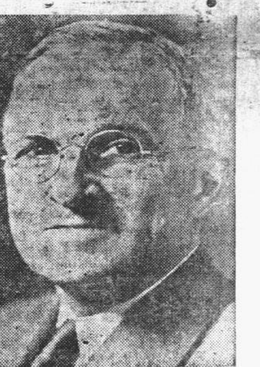
Truman en Méjico

CIUDAD DE MEJICO 4. — Por vía aérea llegó a esta ciudad el Primer mandatario yanqui, Mr. Harry Truman, quien