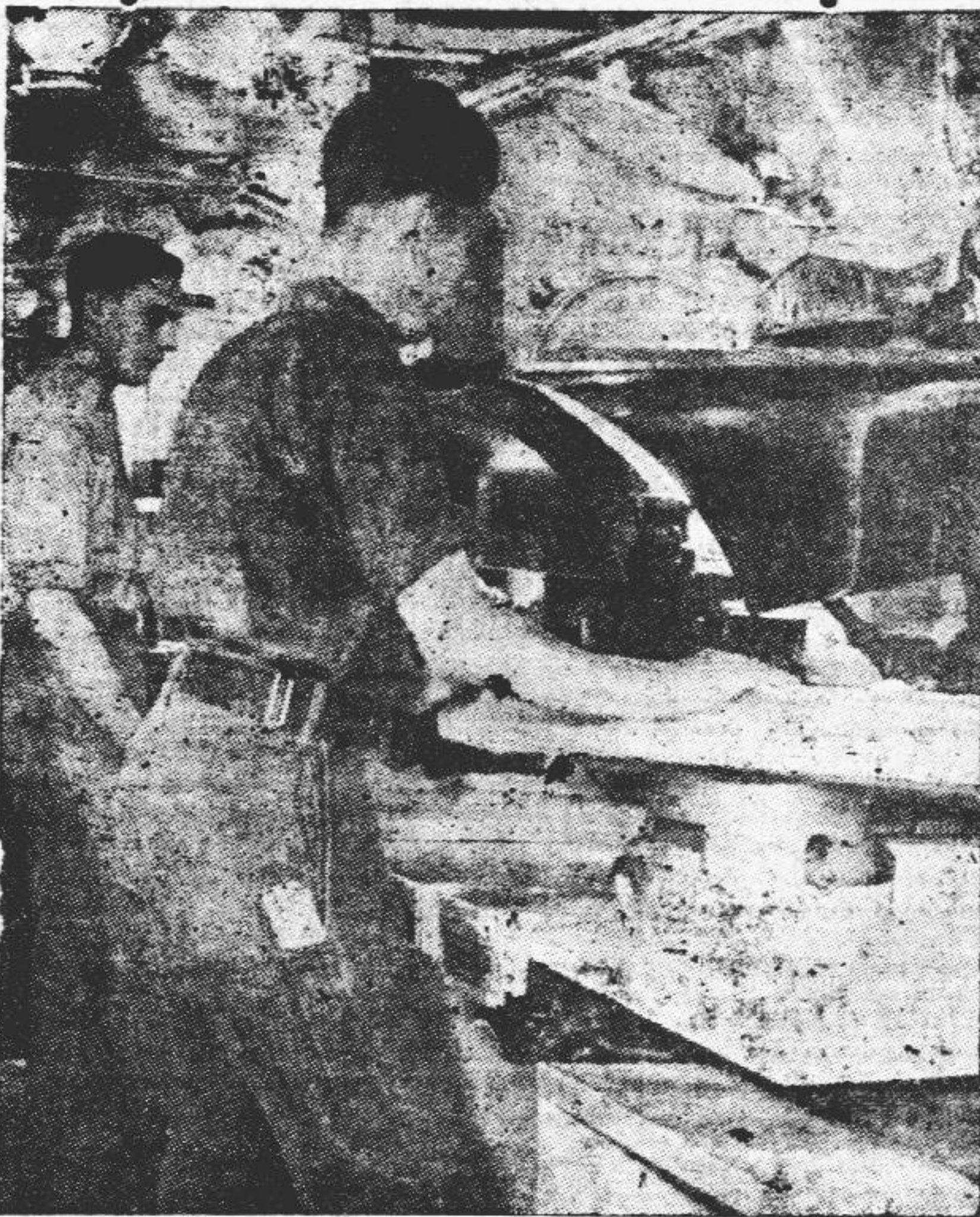
En forma asombrosamente rápida, la industria de guerra se ha transformado en industria de paz. He aquí una fábrica donde hasta hace pocos construían tanques convertida ahora en fábrica de artículos de cera.