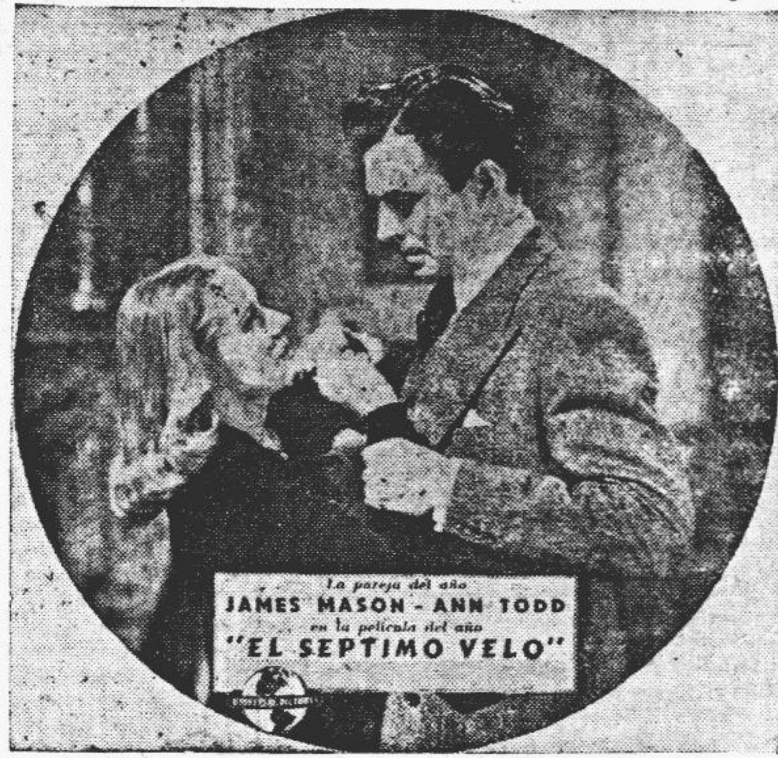
La pareja del año JAMES MASON-ANN TODD en la película del año "EL SEPTIMO VELO"

A las 21 horas: DOS TENORIOS y EL SEPTIMO VELO con J. Mason Ann Todd. Platea 1,20 Pullman 0,70