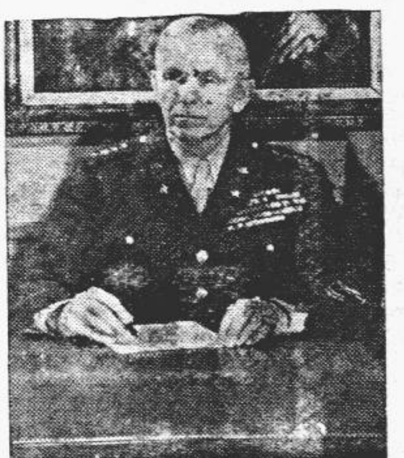
Antes que nada, hablar con el mariscal.

Dispone medio día. Competente 2º año comercial. SE OFRECE. Córdoba 236 Tel. 720. N 220 V. 25.