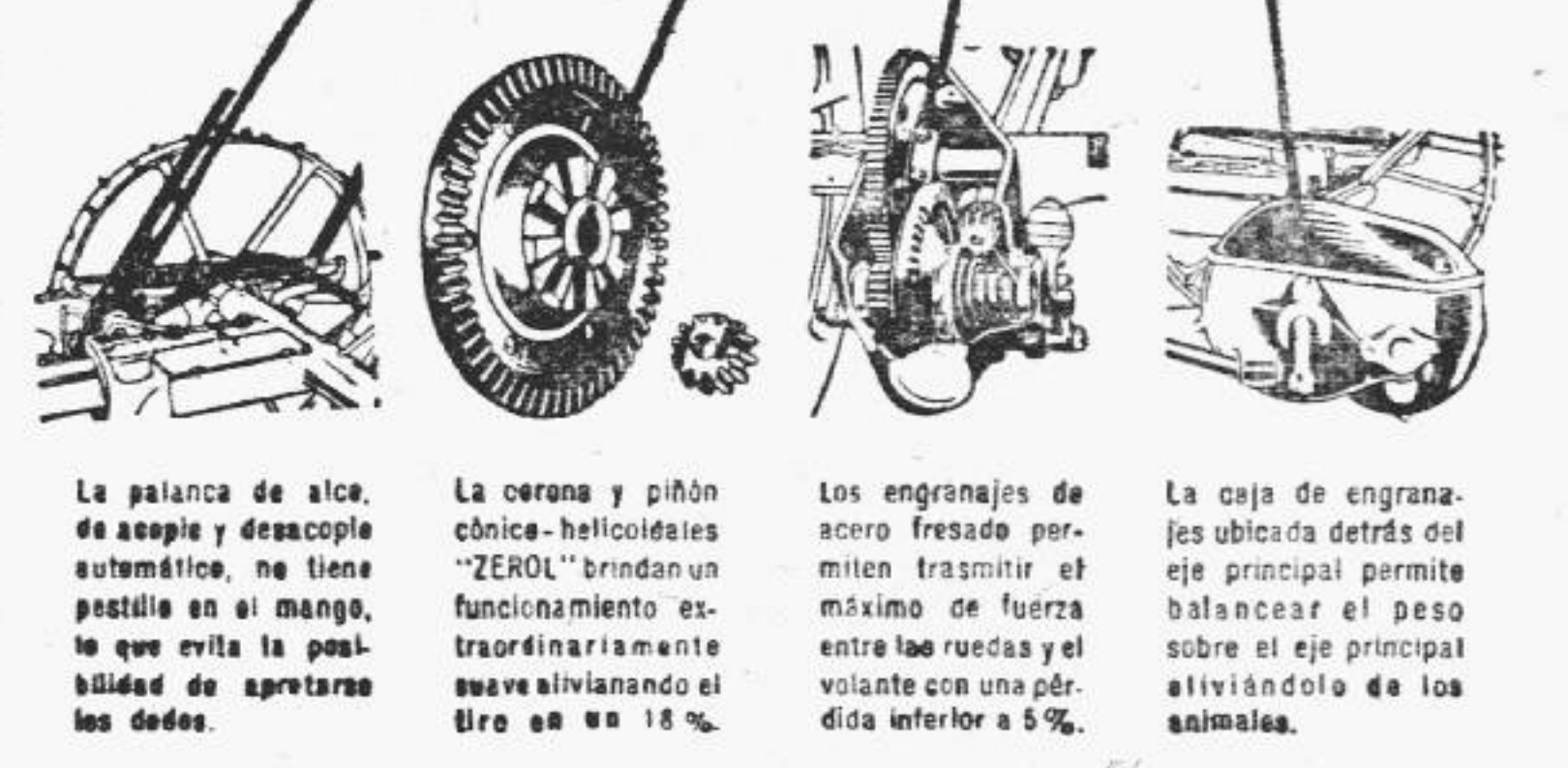
La palanca de acc. de acople y desacople automático, no tiene pestillo en el mango, lo que evita la posibilidad de apretarse los dedos. La corona y piñón cónico-helicoidal "ZEROL" brindan un funcionamiento extraordinariamente suave eliminando el tiro en su 18%. Los engranajes de acero fresaado permiten transmitir el máximo de fuerza entre las ruedas y el volante con una pérdida inferior a 9%. La caja de engranajes ubicada detrás del eje principal permite balancear el peso sobre el eje principal aliviando de los animales.

Es con verdadera satisfacción que ponemos al alcance de nuestros amigos los agricultores los equipos rurales que, por su calidad y eficiencia, contribuyen a facilitar su labor con el máximo de rendimiento. Este es el caso de la nueva Guadañadora McCormick-Deering International No. 9, algunas de cuyas notables ventajas pueden apreciarse en este aviso. Asimismo nos es grato brindar