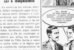
Estas son las delgadas