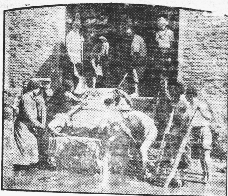
SALVANDO EL ALGODÓN.—Personal del establecimiento C. O. D. E. S. A. L. situado en la calle Canning 3941, realizando tareas de salvamento de fardos de algodón, a causa del incendio declarado esta tarde. Si bien se principio se temió que el siniestro alcanzara grandes dimensiones, la intensa labor de los bomberos de Recoleta evitó mayores consecuencias.