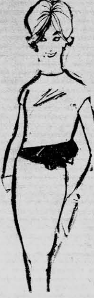
Camisola abotonada atrás de ruedo diagonal, ancha faja de moño en la falda.