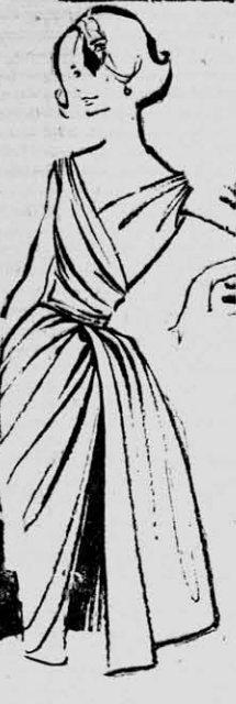
Drápeas envolventes mo- delan la silueta, media sobre falda.