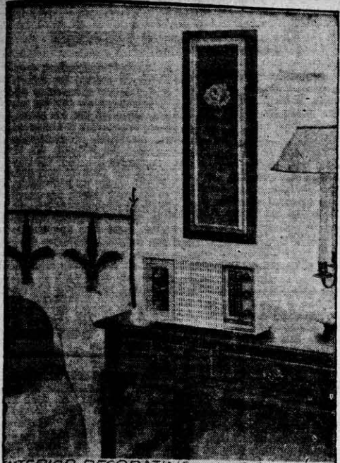
Los accesorios diseñados especialmente para las alcobas están recibiendo una nueva atención en los temas de decoración.