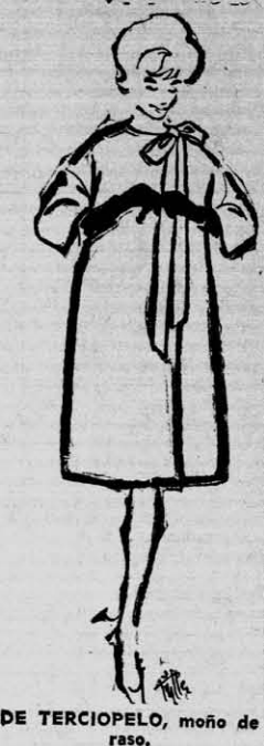
DE TERCIOPELO, moño de raso.

Creaciones YAYA AYACUCHO 387 Teléfono 2870 PRESENTA: Diseños de la Moda