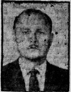
Sr. José M. Montorfano, presidente del organismo máximo del básquetbol argentino, cuyas manifestaciones sobre la actualidad y futuro de este deporte revelan una exacta ubicación y apreciación por parte del destacado dirigente.

El XXIXº Campeonato Argentino de Básquetbol Masculino a disputarse en nuestra ciudad dentro de contados días, encierra para todos los que de una u otra forma, desempeñando diversos engranajes del baloncesto nacional, contribuyen a su difusión y mejoramiento una oportunidad propicia para que en cordial "mesa redonda" se expongan los diversos problemas que afligen a esta manifestación deportiva y las soluciones que a criterio de los que en ella intervengan puedan aplicarse a esos aspectos que lógicamente serán discutidos reflexiva y ampliamente.