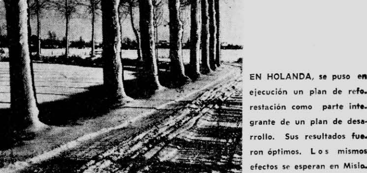
EN HOLANDA, se puso en ejecución un plan de reforestación como parte integrante de un plan de desarrollo. Sus resultados fueron óptimos. Los mismos efectos se esperan en Misiones con su propio plan.