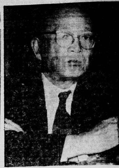
EL CELEBRE filósofo Lin Yutang, se encuentra actualmente en Mar del Plata pasando unos días de descanso. Viajó en automóvil, solicitó un intérprete chino y no quiso hablar de política, "tema que no comprendo", dijo.