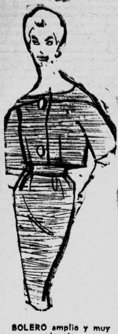
BOLERO amplia y muy cómodo.

Creaciones YAYA AYACUCHO 385 Teléfono 2870 PRESENTA: Diseños de la Moda