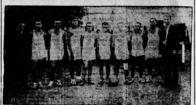
El incipiente básquetbol misionero corria la aventura de enfrentar a un five foráneo y las gestiones se inician ante el club Regatas de Monte Caseros (Corrientes) quien se presentó en nuestro conjunto del club Union, con tratado por el "Posadas Básquet-Ball Club". El monto del contrato para su presentación en cuatro jornadas ascendió a la suma de $ 180 nacionales, incluyendo gastos de estadía. ¿Qué tiempos aquellos! dirán los dirigentes actuales.