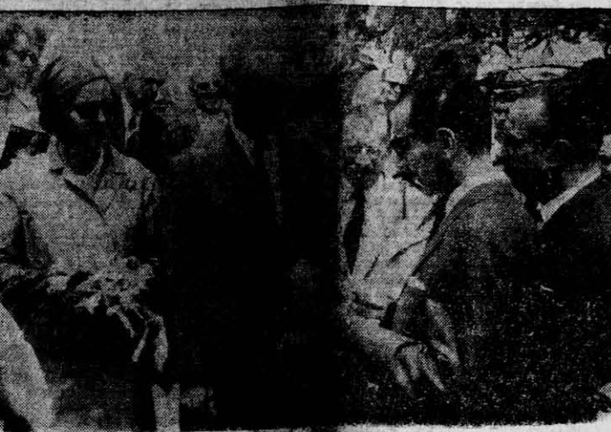
LLEGA LEOPOLDO III A POSADAS. — Nota gráfica tomada instantes en que el intendente de Posadas, señor Raúl Zapelli, da la bienvenida al ex-monarca de Bélgica Leopoldo III y a su esposa la princesa Clotilde. (Información página 4).

SANTIAGO (Chile), 16 (UPI) — Un aterrizaje forzoso por una falla en el motor del motor izquierdo, tuvo ayer un avión V-47 de la Fuerza Aérea Argentina.