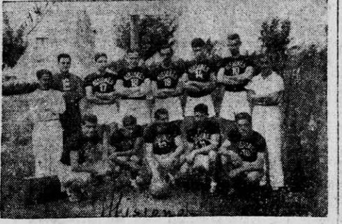
EL DEBUT EN SAN LUIS. En 1943 en San Luis hizo su presentación en el XV Campeonato Argentino de Básquetbol el seleccionado de la Federación Misionera...