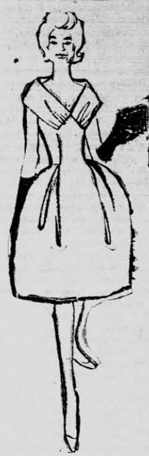
PLIEGUES al bies en un delantal sobrepuesto sobre el corsage y la falda.

Creaciones YAYA AYACUCHO 367 Teléfono 2870 PRESENTA: Diseños de la Moda