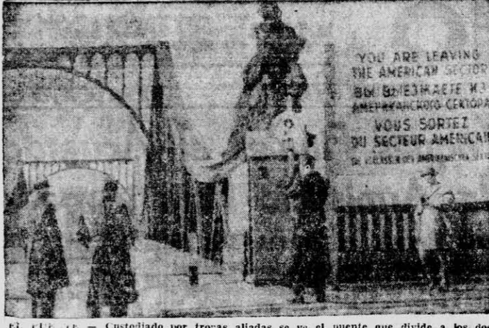
EL FUELE — Custodiado por tropas aliadas se ve el puente que divide a los dos sectores de Berlín, donde fueron canjeados Powers y Abel hace unos días.