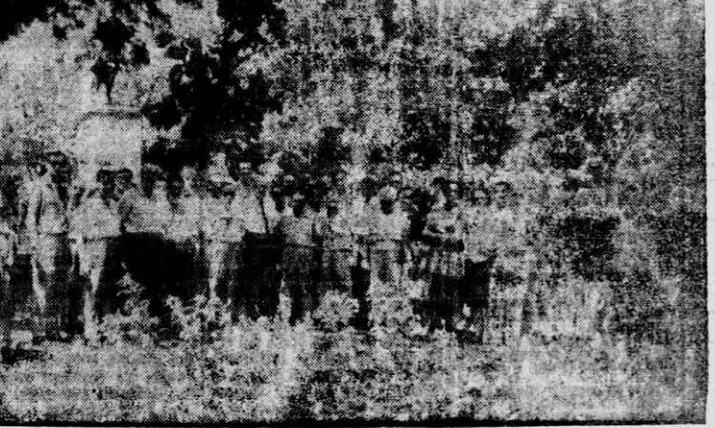
Como un recuerdo permanente del homenaje al prócer máximo de nuestra patria, general San Martín, posan los delegados, dirigentes y jugadores que plantaron el pino que refirmará la ilustre reverencia que el Santo de la Espada despertó en los corazones de quienes viven el XXIXº Campeonato Argentino de Basquetbol.

Un día martes partió la delegación a las 7.30 y 2 horas después el primer infortunio. Un desperfecto en el colectivo obligó a un paréntesis en Ituzingó en don de luego de recorrer el pueblo se reunieron los integrantes de la delegación en la biblioteca local culminando la misma en un improvisado baile a las 11 de la mañana con un grupo de gentiles chicas correntinas. Al mediodía prosiguió el viaje con escalas en Corrientes, Resistencia, San Justo y Córdoba. En Berrotarán (Córdoba) el ómnibus se que do por falta de cubiertas de auxilio, continuando los "aventureros" en un camión hasta Rio Cuarto. Luego de muchas diligencias se contrató un colectivo. No obstante persistía la mala suerte, puesto que hubo una nueva detención en Villa Mercedes, pagos de Alfredo Alonso, y al reiniciar la marcha explotó el matafuegos del ómnibus en circunstancias en que los "excursionistas" dormitaban. La alarma fue prontamente dispada y en la madrugada del sábado llegó la delegación a San Luis alojándose en el Sto. Grupo de Caballería juntamente con los basquetbolistas de Catamarca, La Rioja