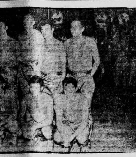
MISIONES, que sin rendir todo lo que es capaz, puso en duro trance el triunfo de los mendocinos en el último match de anoche en la jornada del anfiteatro.

Cancha: Anfiteatro "Manuel Antonio Ramirez" 19,15 hs. Mendoza vs. San Juan 20,30 hs. Corrientes vs. Córdoba 21,45 hs. Misiones vs. Tucumán 23,00 hs. Santa Fe vs. Chaco Cancha: Jorge G. Brown 19,15 hs. Catamarca vs. Jujuy 20,30 hs. Cap. Federal vs. Prov. Buenos Aires Cancha: Asociación Racing Club 19,15 hs. Santiago del Estero vs. La Rioja 20,30 hs. Formosa vs. Salta