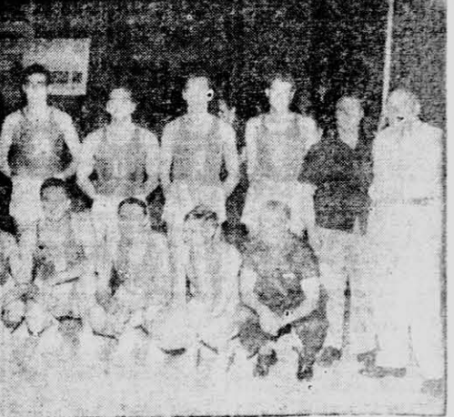
MENDOZA GANA CON SUSTO. En efecto, el trámite de la lucha significó para el ganador una gestión que tuvo sus dificultades, ya que sus rivales se prodigaron estimulados por el constante aliento del público.