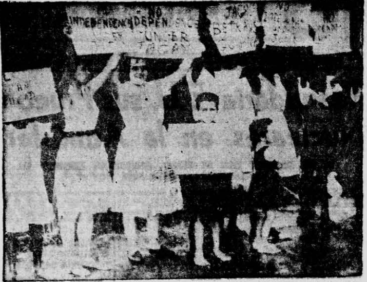
ANTIJAGAN — Manifestantes de origen británico portan cartelones en los cuales se pide que no se de la independencia a la Guayana bajo el gobierno de Jagan. Los manifestantes desfilaron con sus cartelones frente al príncipe Felipe, cuando éste visitó la capital de la Guayana, Georgetown.