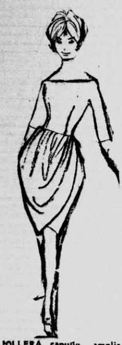
OLLERA capullo, amplia en la cadera cruzada.