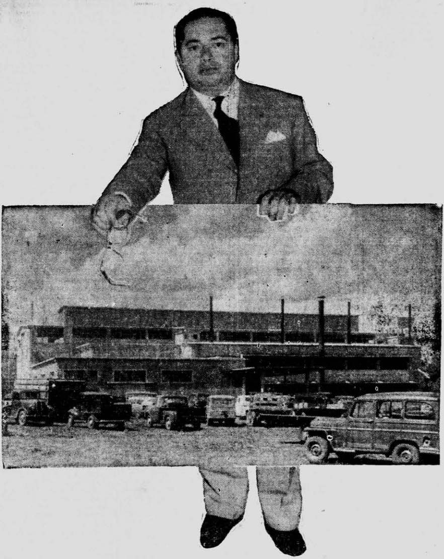
Planta elaboradora de té de la Coop. de Montecarlo instalada con ayuda del Estado

PODER EJECUTIVO DE LA PROVINCIA DE MISIONES