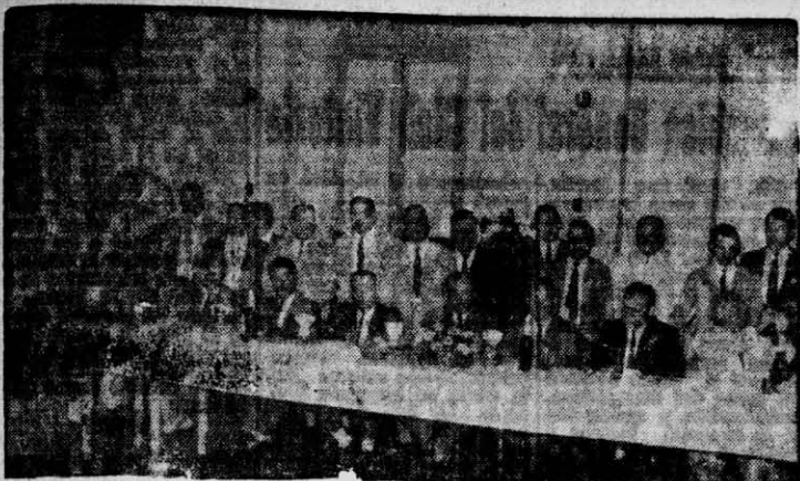
DIRECTIVOS DE IKA Y SUS AGENTES EN EL NORDESTE se reúnen en Convención para promover ventas y en una fiesta de camaradería. Los vemos acá rodeados de unas largas mesas en el comedor del Savoy Hotel.