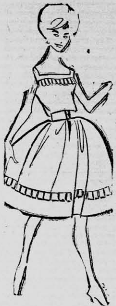
Aplicación plegada en el escote y ruedo