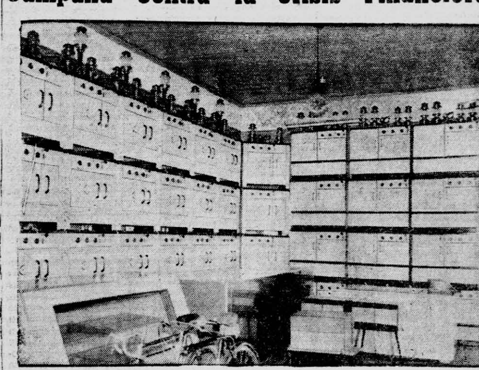
Exposición de cocinas y artefactos "Volcán" en Imlauer y Cia. S. A.

Indudablemente, durante el transcurso de los últimos tiempos, nuestra población se vio exigida a restringirse en sus adquisiciones tendiendo al equipamiento hogareño de los artefactos de tan fundamental importancia que la moderna economía no los considera ya como suntuarios.