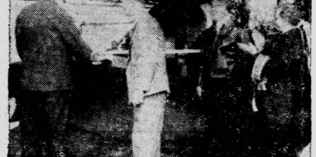
INAUGURACION.— Momento en que los presidentes de ARYA y de la Cooperativa Agrícola de Colonia Polana cortan la cinta...