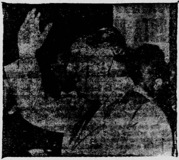
NO PUDO.— Manuel Odría, ex presidente del Perú, quien poco antes de que las fuerzas armadas se apoderaran del gobierno, expresó que aceptaba la presidencia de su país, como una fórmula de transición a fin de terminar con la crisis que se había planteado.

LIMA 18 (UPI).— Una columna de 50 tanques, vehículos blindados y camiones llenos de soldados poderosamente armados rodearon el palacio presidencial en las primeras horas de hoy y se apoderaron del edificio, en lo que parece ser un golpe de mano de los militares para tomar el gobierno.