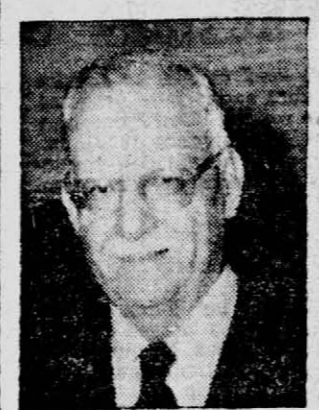
Falleció en Rosario