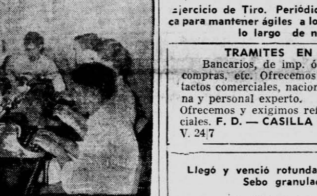
Escuela de aprendices de Concepción de la Sierra. Recientemente fue creada por Gendarmería Nacional. Asisten gratuitamente jóvenes de la zona que aprenden distintos oficios.