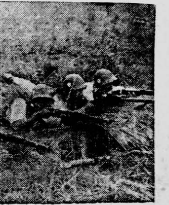
Ejercicio de Tiro. Periódicamente se realiza esta práctica para mantener ágiles a los efectivos de Gendarmería a lo largo de nuestras fronteras.