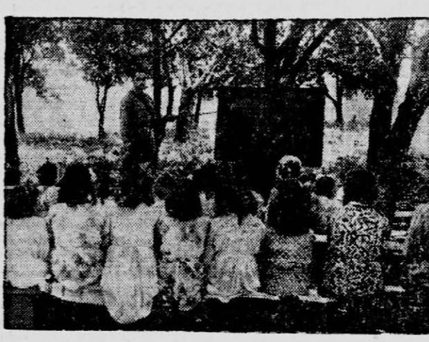
Enseñando las primeras letras. No hay escuelas en algunos centros. Gendarmería gestiona con los pobladores la creación de las mismas y mientras enseñan.