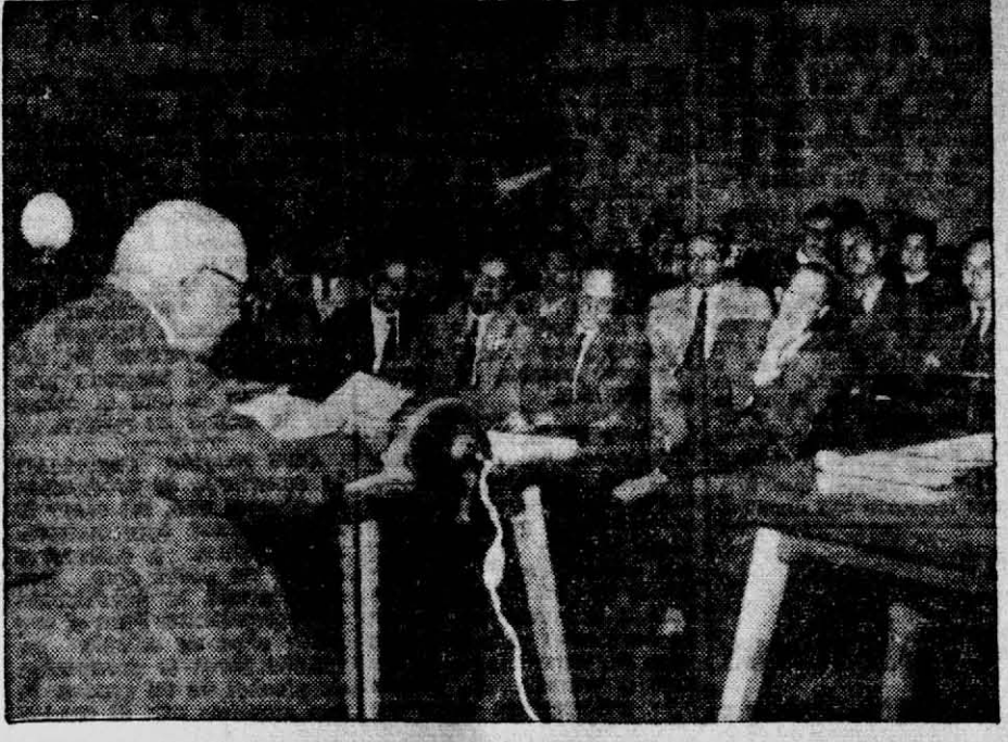
EMBALSE PIRAY GUAZÚ. El grabado ilustra un aspecto de la conferencia dada por los integrantes del grupo Incoas...