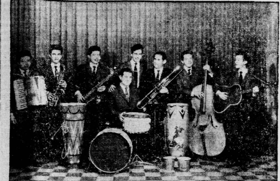
Integrantes de la "BANDA OCARA" y los alegres muchachos de las "Estrellas Obeheras del Jazz", que mañana animarán el gran baile de los liberales paraguayos a llevarse a cabo, a partir de las 21 horas, en las amplias instalaciones del Club Independiente, sito en prolongación Bolívar y Wanish.