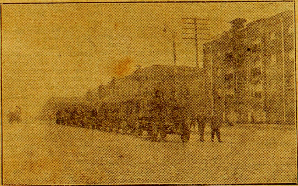
El NASH QUAD arrastrando 8 troleys cargados de carbón, durante las pruebas en las calles adyacentes al Puerto

Una interesante demostración sobre el poder de arrastre de camiones, se realizó en el puerto de la capital, en presencia de autoridades de la Aduana y de un escribano público