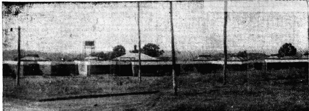
HOSTERIA.— La Hostería de Turismo a la que hay que dotar de una pileta de natación y plantar árboles a su alrededor a fin de proporcionarle sombra.