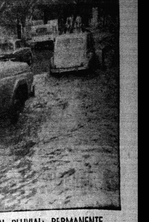
LA PRECIPITACION PLUVIAL: PERMANENTE ENEMIGO DE LA CIUDAD DESARREGlada