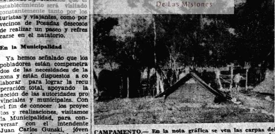
CAMPAMENTO.— En la nota gráfica se ven las carpas del campamento de Educación Física, donde pasan sus vacaciones estudiantes de distintas poblaciones de la provincia.

Recuperar las Tierras En primer término, y como punto más importante, entendemos que debe tratarse por todos los medios de recuperar para la agricultura las tierras empobrecidas a causa de la explotación intensiva en épocas pasadas y por el abandono en que han permanecido durante los últimos años. El Ministerio de Asuntos Agrarios, por medio de sus técnicos especializados, debe ser el encargado de llevar a cabo tal labor, que por muy costosa que sea, resultará beneficiosa a muy corto plazo, tanto en lo que al orden económico se refiere