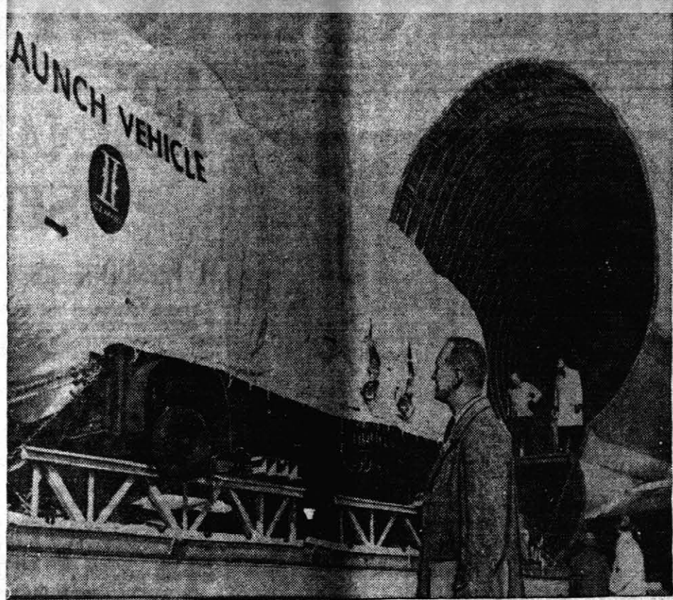
LA SEGUNDA ETAPA DEL COHETE GEMINI VOLADA HASTA CABO KENNEDY — La segunda etapa del cohete Gemini N° 3, el cual está destinado a poner a dos americanos en órbita esta primavera, es cargada a bordo de un avión Boeing modificado en la planta de la compañía Martin en Baltimore, Maryland, para ser llevada hasta Cabo Kennedy, Florida.

La segunda etapa del cohete Gemini N° 3, el cual está destinado a poner a dos americanos en órbita esta primavera, es cargada a bordo de un avión Boeing modificado en la planta de la compañía Martin en Baltimore, Maryland, para ser llevada hasta Cabo Kennedy, Florida.