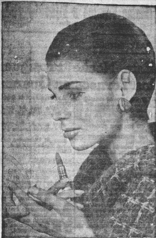
Un peinado tan liso como la piel de una foca, por R. Keith, de Nueva York. El maquillaje de los ojos debe ser más pesado.