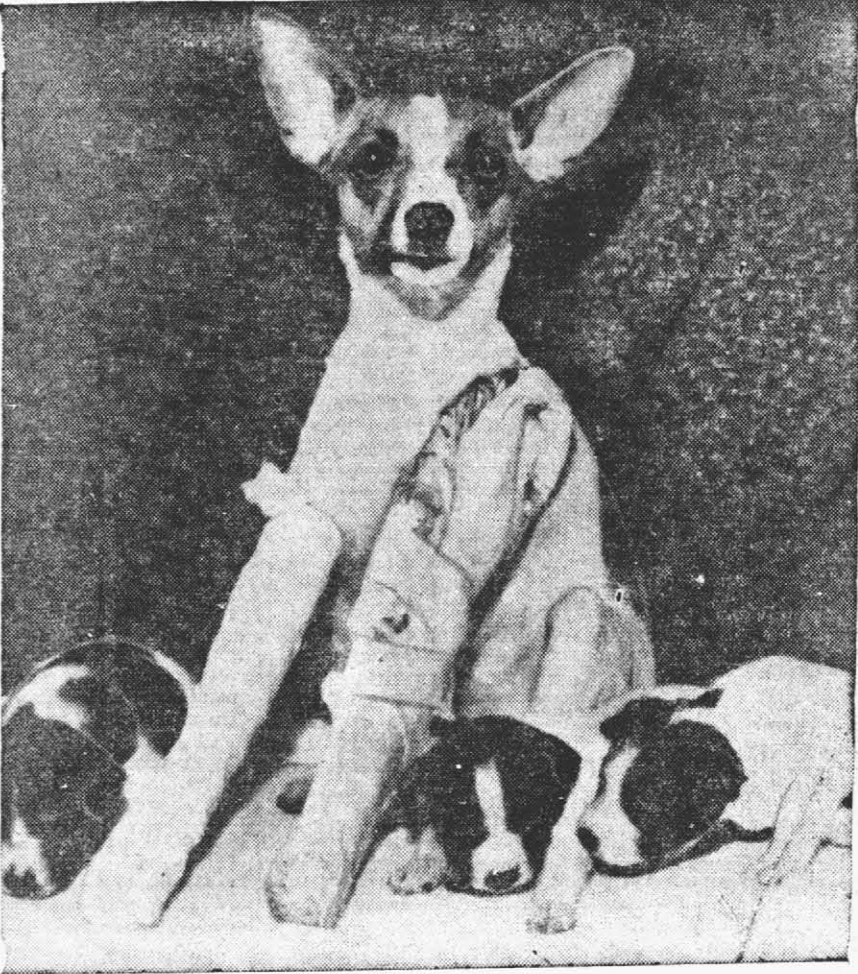
UN PEQUEÑO SALTO FUE EL CAUSANTE - Sissie, una chihuahua de un año de edad...